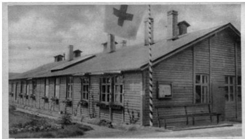
Lazarethbaracke in Hameln Baraque d'hôpital à Hameln Hospital barack at Hameln Лазаретный баракъ въ Гамельнѣ