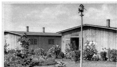
Schule und Postamt in Hameln Ecole et Poste à Hameln School and Post-office at Hameln Школа и почта въ Гамельнѣ