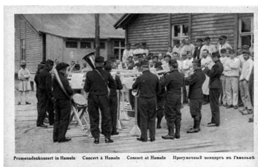
Promenadenkonzert in Hameln Concert à Hameln Concert at Hameln Проломаный концертъ въ Гамельнѣ