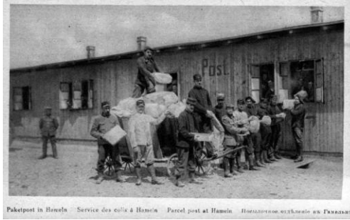
Paképost in Hameln - Service des colis à Hameln - Parcel post at Hameln - ΠΑΚΕΤΟΠΟΣΤΗΝ ΣΤΑΜΑΤΙΟΝ ΑΝ ΤΑΜΕΙΟΝ