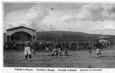
Football in Hameln - Football à Hameln - Football at Hameln - ΦΥΡΕΑΣ ΑΝ ΤΑΜΕΙΟΝ