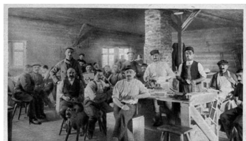
Werkstatt in Hameln Atelier à Hameln Workshop at Hameln Мастерская въ Гамельнѣ